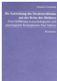
Die Entstehung des Strukturalismus aus der Krise des Dichters