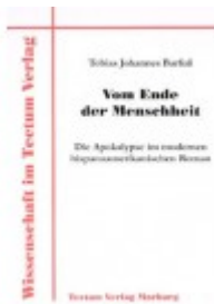
Vom Ende der Menschheit