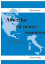
"Amerika ist immer woanders"