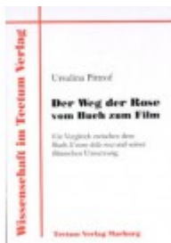
Der Weg der Rose vom Buch zum Film