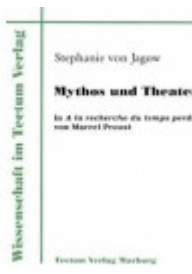
Mythos und Theater in A la recherche du temps perdu von Marcel Proust