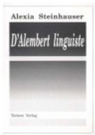
D' Alembert linguiste