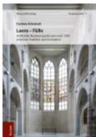
Leere - Fülle