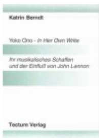
Yoko Ono - In Her Own Write